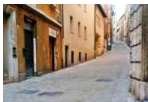
transito limitato da corso Stamira