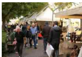
Nel fine settimana tornano i mercatini natalizi in viale della Vittoria