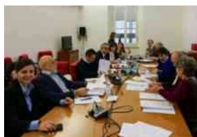
Via libera della prima commissione al bilancio di previsione 2020/2022