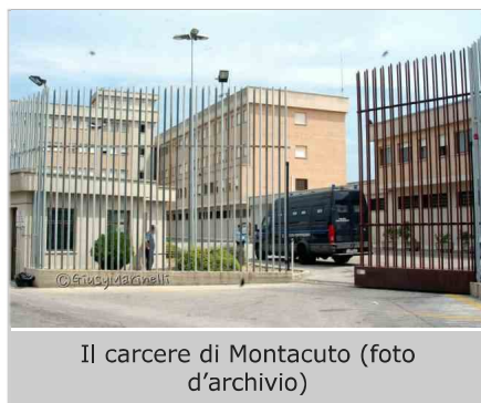
Il carcere di Montacuto